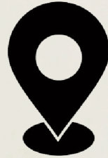
قاعة الندوات بالمركز الجامعي إيزبي