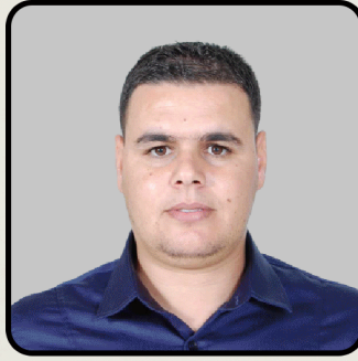
رئيس اللجنة العلمية للندوة الوطنية الدكتور فلاك مراد